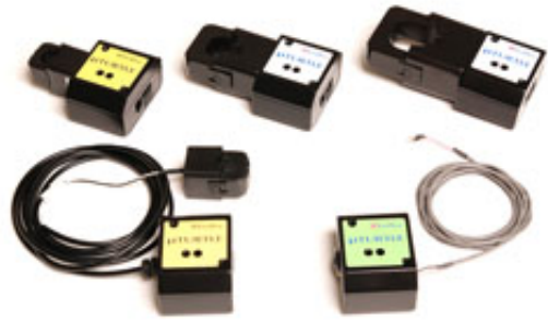
無線式設備データ収集システム 「μTURTLE」