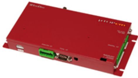
遠隔監視システム「GENES REMOTE」