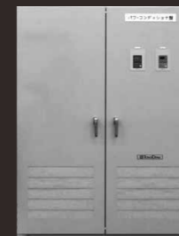
パワーコンディショナ