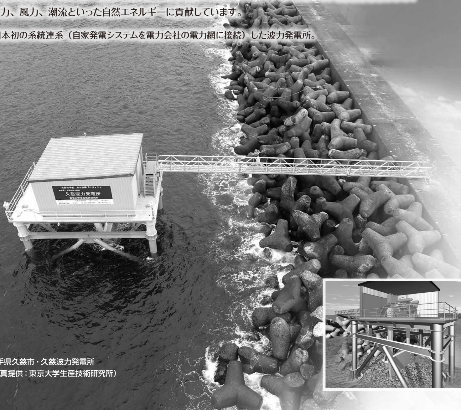
岩手県久慈市・久慈波力発電所

* 日本初の系統連系（自家発電システムを電力会社の電力網に接続）した波力発電所。