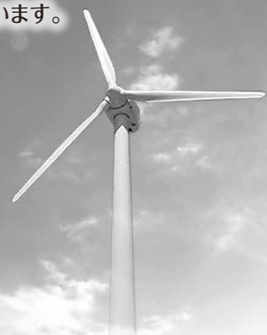
沖縄県久米島町・風力発電所