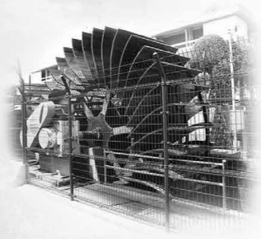
山梨県都留市・家中川小水力発電所