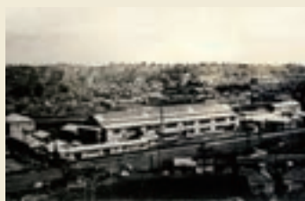
操業開始当時の横浜工場(横浜市保土ヶ谷区)