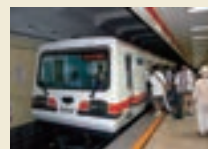
中国・北京市 復八線

1998 ● わが国で初めて北京市に地下鉄電車用VVVFインバータ駆動電機品を納入(復八線)