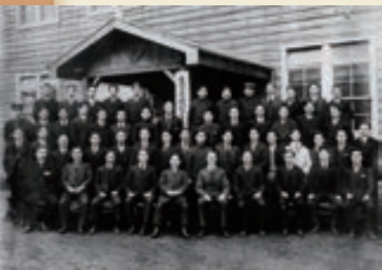
当社社員と、提携先英ディッカー社の技術指導員との集合写真