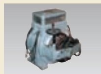
三相交流整流子電動機(シユラゲ形※のちのASモータ)