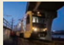
アメリカ・ロサンゼルス郡都市圏交通局P3010形LRV