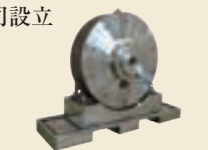
インタイヤハウスダイナモ