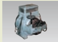
三相交流整流子電動機(シュラゲ形、のちのASモータ)