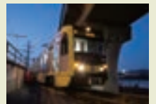
アメリカ・ロサンゼルス都市圏交通局P3010形LRV