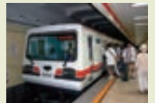
中国・北京市 復八線

1998 ●わが国で初めて北京市に地下鉄電車でVVVFインバータ駆動電機品を納入(復八線)