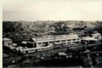
操業開始当時の横浜工場(横浜市保土ヶ谷区)