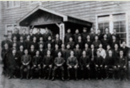
当社社員と、提携先英ディッカー社の技術指導員との集合写真